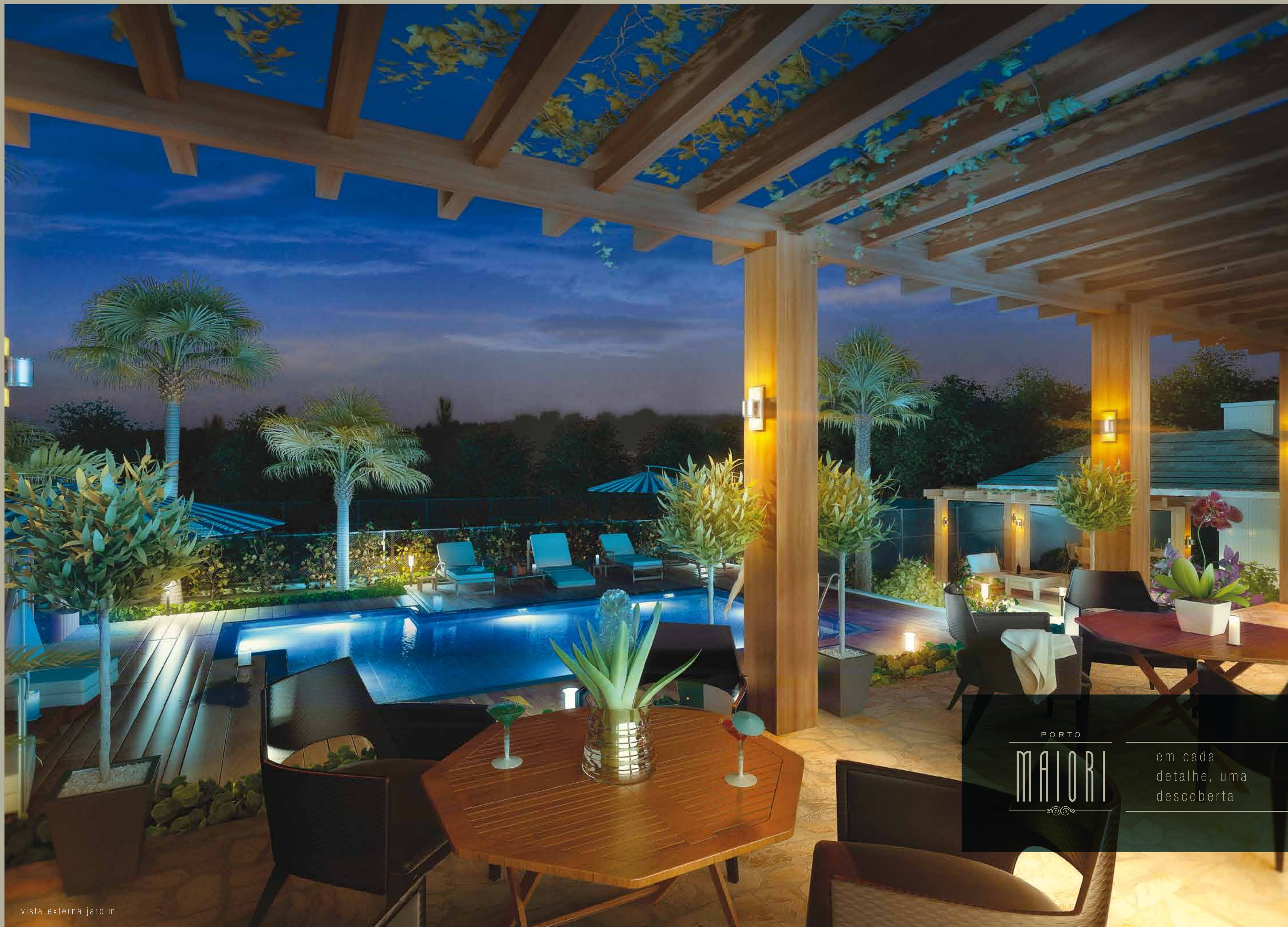
vista externa jardim