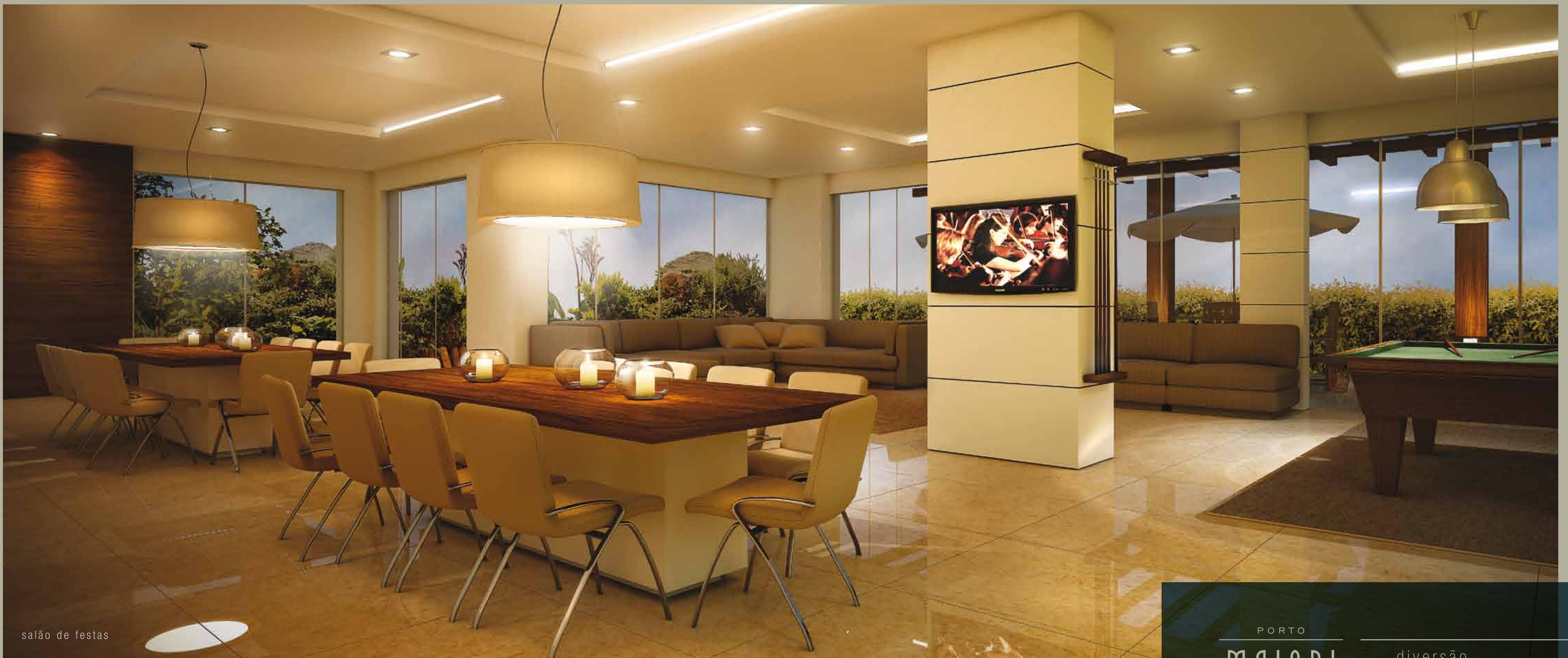
salão de festas