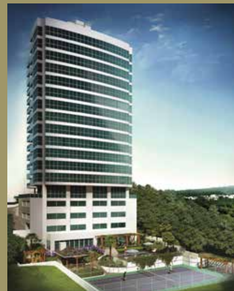
Condomínio Residencial Porto Maiori Rua Estefânia Pasquali Éder, 397, Cidade Alta