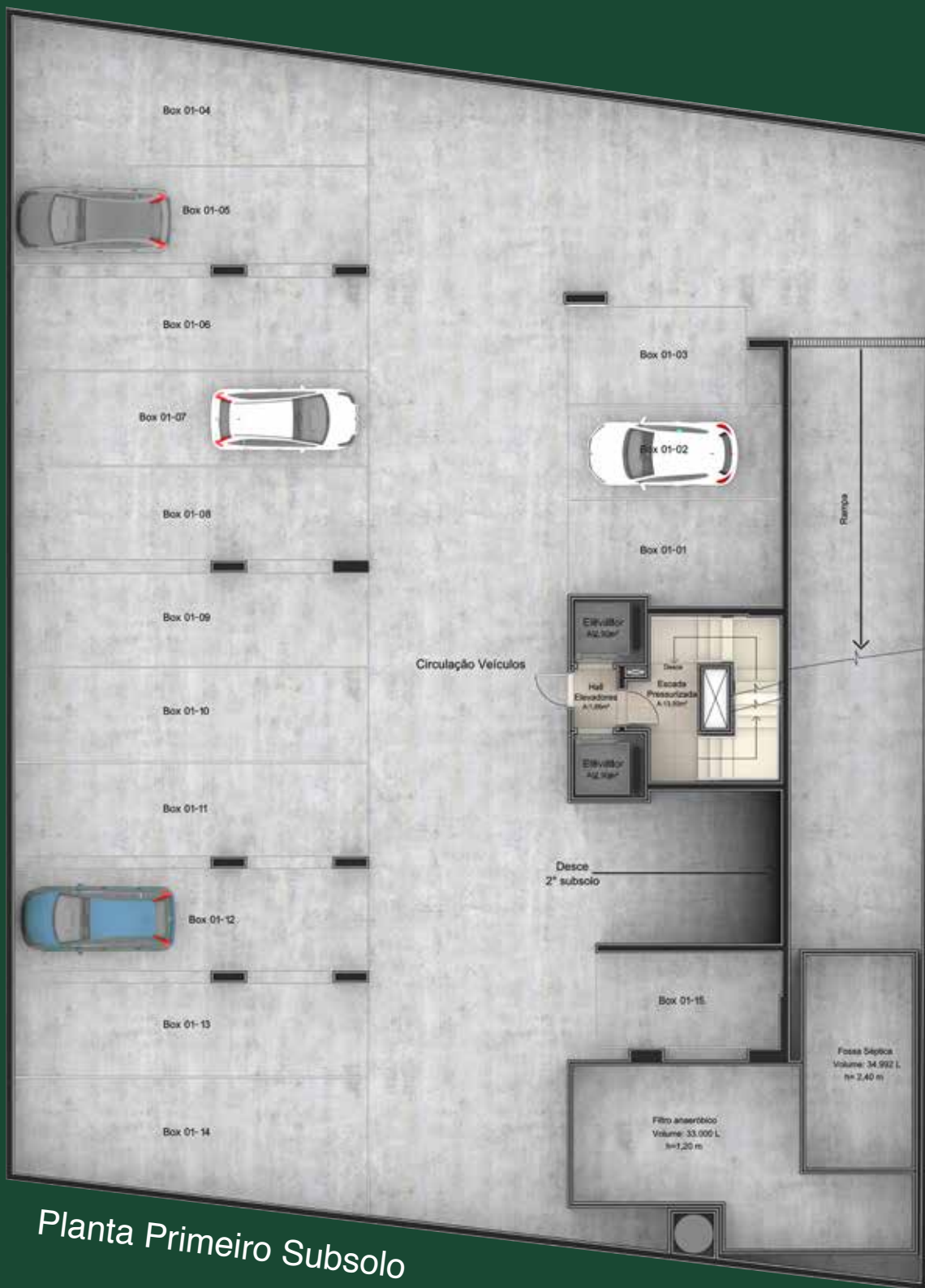
Planta Primeiro Subsolo