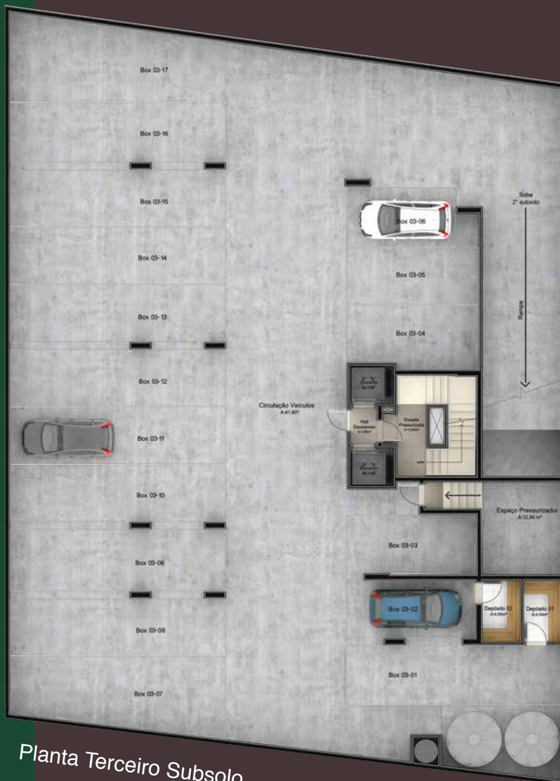
Planta Terceiro Subsolo

Garagens simples e duplas, com facilidade de acesso e circulação