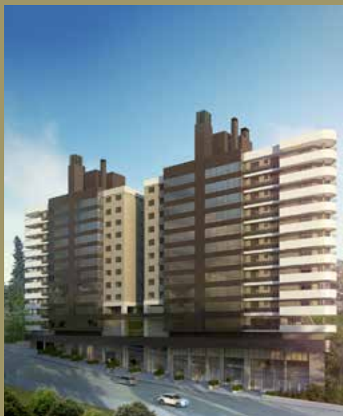
Residencial Torres de Sevilha Travessa Manaus, 109, Cidade Alta