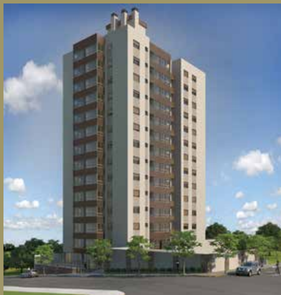
Residência Vivaldi Rua General Vitorino, esquina com Rua Borges do Canto, Bairro São Francisco